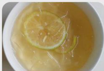
湯品 冬瓜檸檬愛玉甜湯