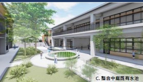
C. 整合中庭既有水池